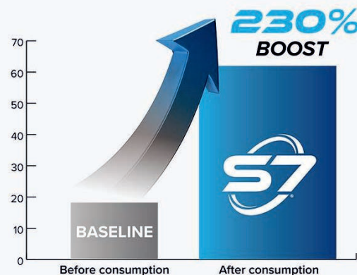
Circulating nitric oxide concentration (nM)

*Study references available upon request